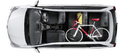
▶ ที่นั่งแถว 2 และ 3 พับแยกได้ ปรับเปลี่ยนรูปแบบตามที่ต้องการ เพิ่มพื้นที่มากขึ้น รองรับการใช้สัมภาระ ที่มีขนาดและรูปร่างที่หลากหลาย