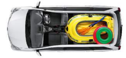
▶ พับที่นั่งแถว 2 และที่นั่งแถว 3 ทั้งสองด้าน รองรับความต้องการใช้รถขึ้น ให้อ่าง เพิ่มพื้นที่สำหรับเก็บสัมภาระขนาดใหญ่ขึ้น