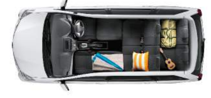
▶ พับที่นั่งพนักพิง และพนักโดยสารด้านหน้า แบบนอนราบ เชื่อมต่อที่นั่งทางด้านหน้า กับที่นั่งแถว 2 เพื่อการพักผ่อนระหว่างเดินทาง