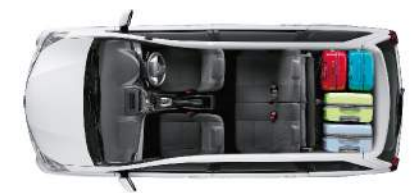
ที่นั่งปรับเปลี่ยนรูปแบบได้หลากหลาย ▶ พับลงที่นั่งแถว 3 ไปด้านหน้า เพิ่มพื้นที่สำหรับเก็บกระเป๋าเดินทาง