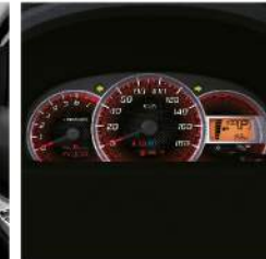
แผงคอนโซลหน้าดีไซน์ใหม่ ล้ำสไตล์กับการออกแบบภายในใหม่ ที่เน้นอารมณ์สปอร์ตยิ่งขึ้น