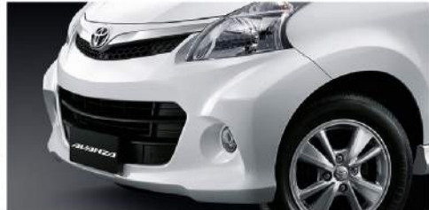
โคมไฟ Multi Reflector สไตล์ล้ำ เพิ่มความโดดเด่น เดิมขับสนปอร์ต