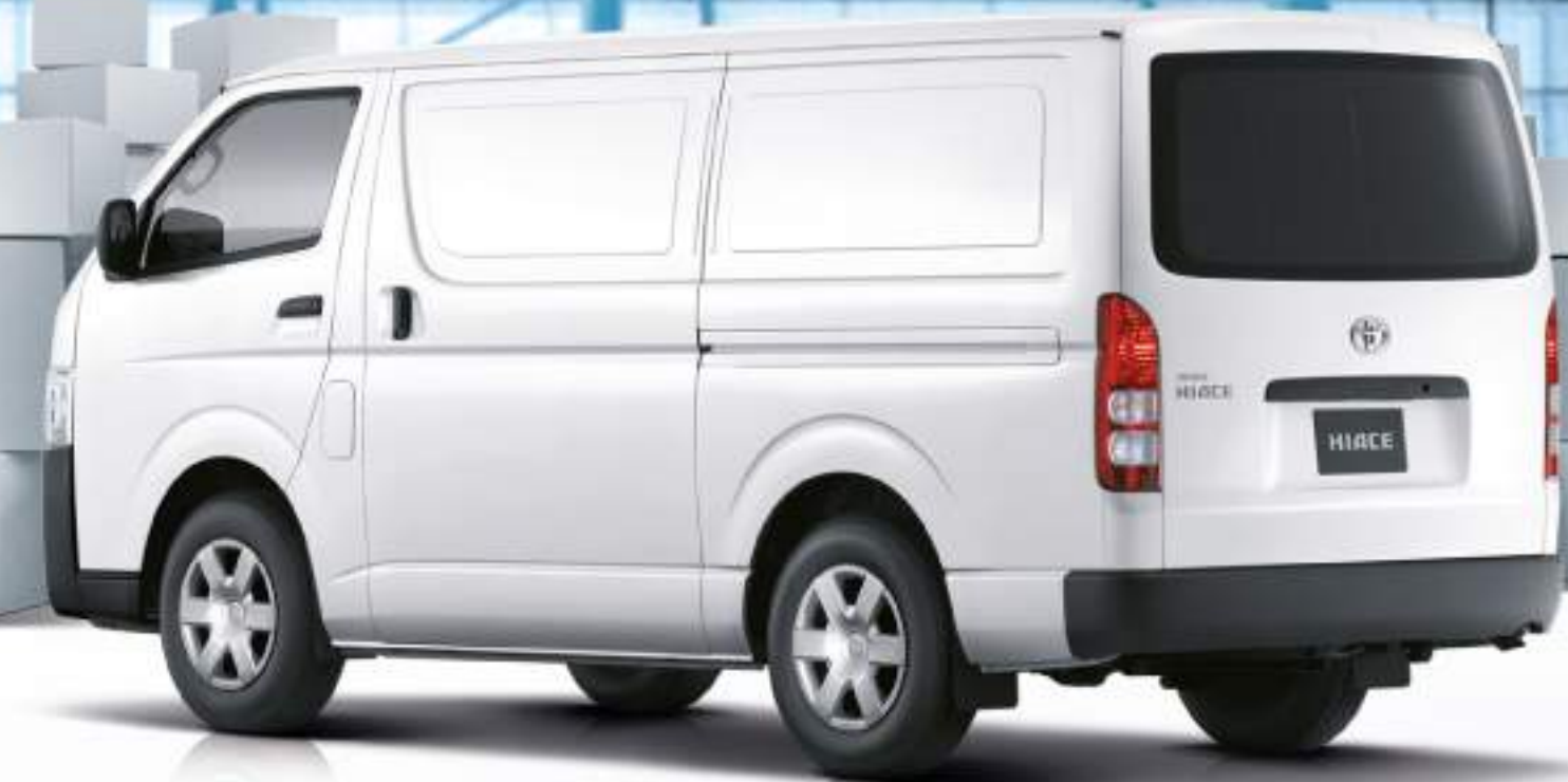
ไฮเอซ Eco ตู้ทีป

เครื่องยนต์ดีเซล 3.0 ลิตร เทอร์โบ อินเตอร์คูลเลอร์