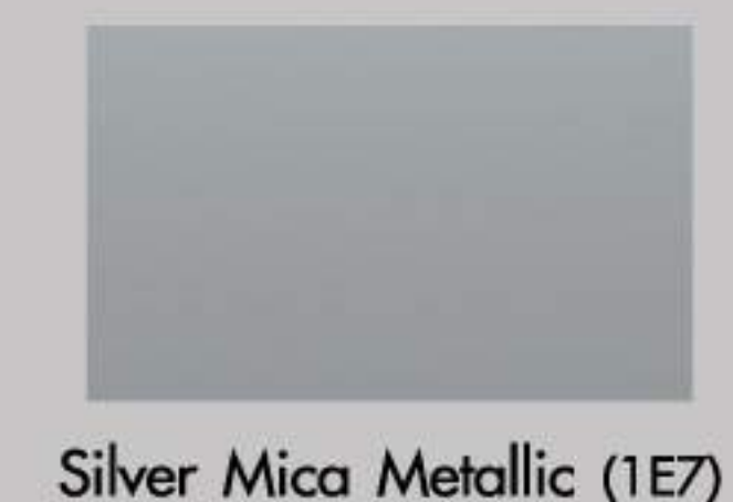
Silver Mica Metallic (1E7)