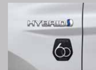
สัญลักษณ์ 60 ปี บริเวณด้านข้างซ้าย-ขวา