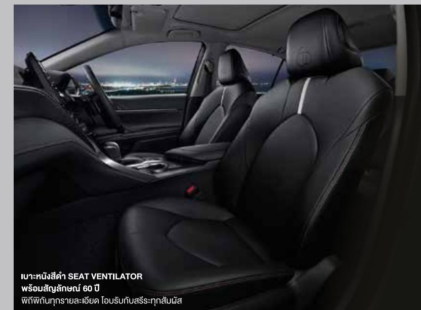
เบาะหนังสีดำ SEAT VENTILATOR พร้อมสัญลักษณ์ 60 ปี พิถีพิถันทุกรายละเอียด โอบรับกับสรีระทุกสัณนิษ