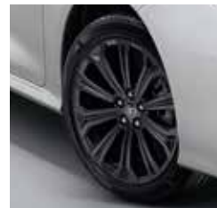
ล้ออัลลอยสีเทา ขนาด 17 นิ้ว สไตล์พรีเมียม