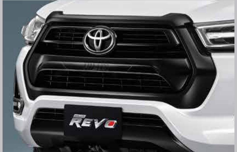
กระจังหน้าสีด้ามทึบ และสีตัวตกแต่ง พร้อมสัญลักษณ์ HILUX ดีไซน์เหนือระดับ ที่ลงตัวทุกมิติ