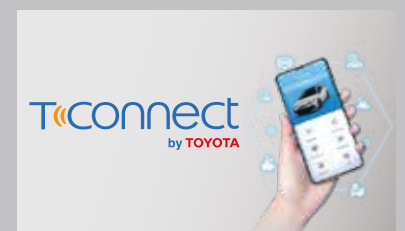
แอปพลิเคชัน T-Connect* สะดวกสบายยิ่งขึ้นด้วยบริการใหม่ เชื่อมการขับเคลื่อนแห่งอนาคต