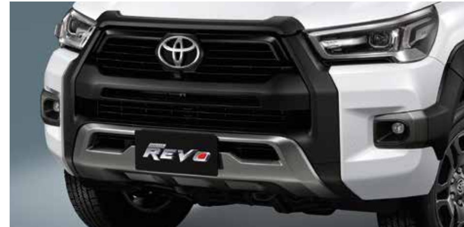
กระจังหน้าสีเทาเข้ม และสีด้ามทึบ จับแน่นเส้นสายที่โดดเด่น ดึงดูดทุกสายตา