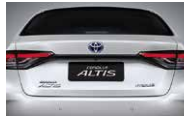
คิ้วตกแต่งฝาท้ายสีดำนางา เพิ่มสไตล์ให้สวยเต็มขั้น