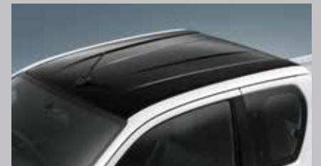
หลังคาดีไซน์ใหม่ สีดำสโตนสปอร์ต สะท้อนตัวตนที่แตกต่าง