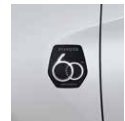
สัญลักษณ์ 60 ปี บริเวณด้านข้างซ้าย-ขวา