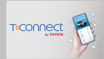
แอปพลิเคชัน T-Connect* สะดวกสบายยิ่งขึ้นด้วยบริการใหม่ เชื่อมการจับเคลื่อนที่แห่งอนาคต