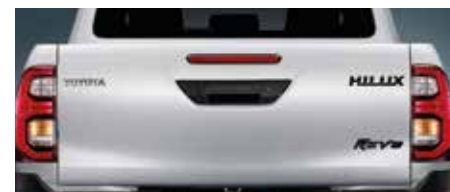
สัญลักษณ์ HILUX และ HILUX REVO สีพิเศษ บริเวณฝาท้ายกระบะ-