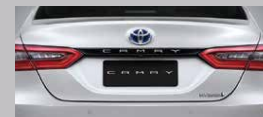
คิ้วตกแต่งฝาท้ายสีดำนางา เรียบหรู สดกทุกองศา