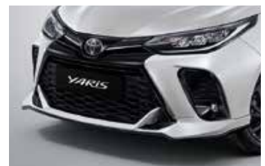
สเกิร์ตหน้าดีไซน์สปอร์ต ทันสมัยในสไตล์ที่โดดเด่น