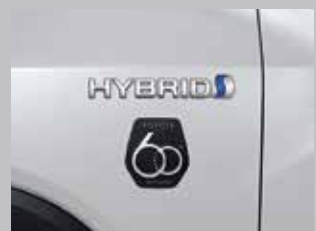
สัญลักษณ์ 60 ปี บริเวณด้านข้างซ้าย-ขวา