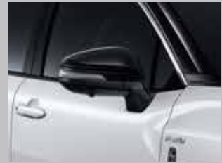
กระจกมองข้างสีดำนามา เต็มเต็มสไตล์ให้สวยงามทุกองศา