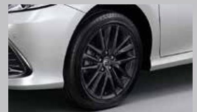
ล้ออัลลอยสีเทา ขนาด 18 นิ้ว สไตล์พรีเมียม