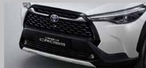
คิ้วกระจังหน้าโครเมียม สไตล์ใหม่ที่ลงตัว