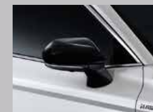
กระจกมองข้างสีดำนางา เติมเต็มสไตล์ให้สวยทุกองศา