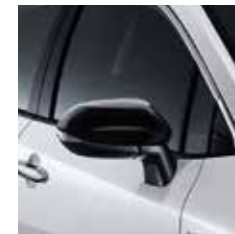
กระจกมองข้างสีดำนางา เติมเต็มสไตล์ให้สวยทุกองศา