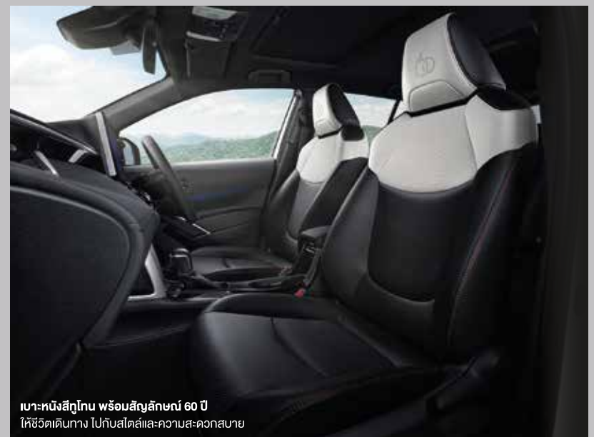
เบาะหนังสีทูโทน พร้อมสัญลักษณ์ 60 ปี ให้ชีวิตเดินทาง ไปกับสไตล์และความสะดวกสบาย