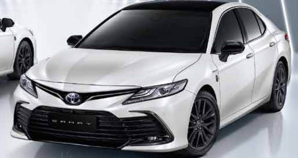
2.5 HEV PREMIUM LUXURY