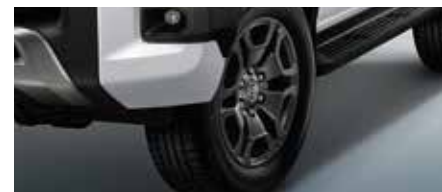
ล้ออัลลอยสีเทา 18 นิ้ว ดีไซน์เหนือชั้นทุกรายละเอียด