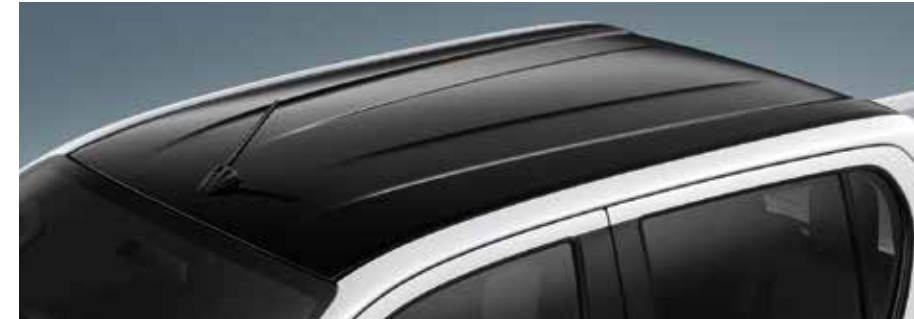
หลังคาดีไซน์ใหม่ สีดำสโตนสปอร์ต สะท้อนตัวตนที่แตกต่าง