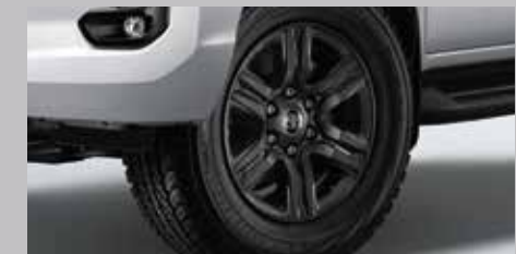
ล้ออัลลอยสีเทา 17 นิ้ว โฉนดเดียวกับรุ่นมบอง หมายเหตุ: ยกเว้นรุ่น สปรนท พื้น 4x4 HIGH เป็นล้ออัลลอยสีเทา 18 นิ้ว