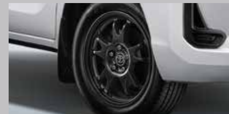
ล้ออัลลอยสตีล 17 นิ้ว โดดเด่นทุกมุมมอง