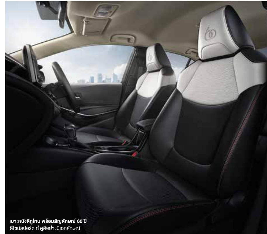
เบาะหนังสีทูโทน พร้อมสัญลักษณ์ 60 ปี ดีไซน์สปอร์ตแท้ ดูได้อย่างมีเอกลักษณ์