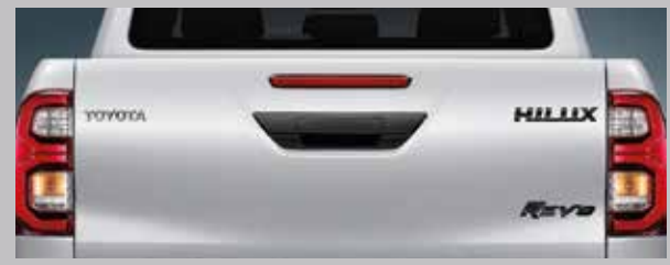
สัญลักษณ์ HILUX และ HILUX REVO สีพิเศษ บริเวณท้ายท้ายกระบะ