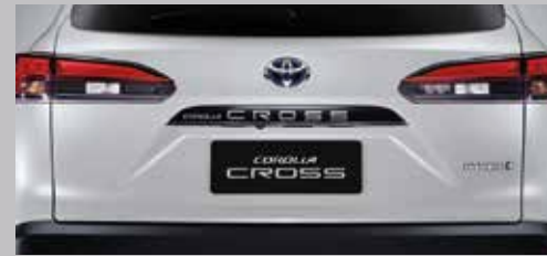
คิ้วคอกแต่งนำท้ายสีดำนามา เพิ่มมิติสไตล์ให้โดดเด่น