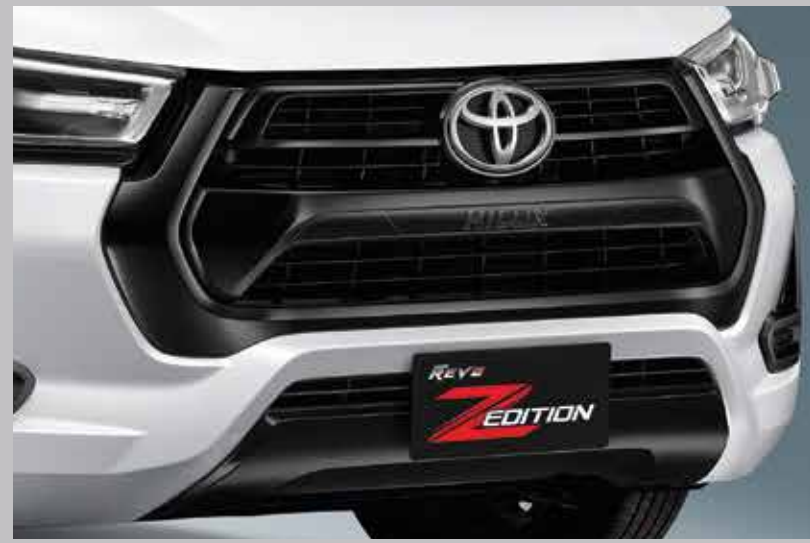
กระจุกหน้าสีด้ามเหล็ก และคิ้วคอกแต่ง พร้อมสัญลักษณ์ HILUX เสริมความเร่าใจไปอีกขั้น