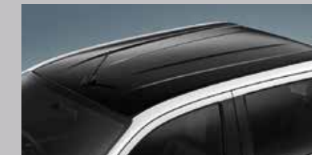
หลังคาโซนี่ใหม่ สีดำสโกลด์สปอร์ต สะท้อนตัวตนที่แตกต่าง