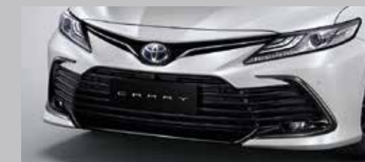
กระจังหน้าสีดำนางา พร้อมชุดตกแต่งโครเมียมบนค้ำ สง่างามอย่างไร้ที่ติ