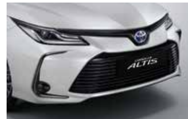
กระจังหน้าสีดำนางา พร้อมชุดตกแต่งโครเมียมบนค้ำ ความสปอร์ตใหม่ที่ลงตัว