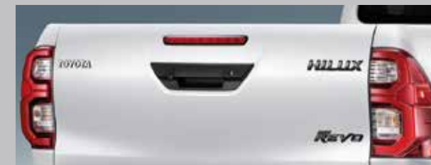
สัญลักษณ์ HILUX และ HILUX REVO สีพิเศษ บริเวณฝาท้ายกระบะ-