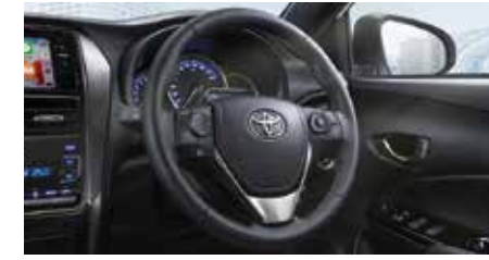
พวงมาลัยหุ้มหนังตกแต่งด้วยด้ายสีเทา และแถบเมทัลลิก จับกระชับแน่นใจ ให้อารมณ์สปอร์ต