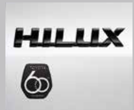
สัญลักษณ์ 60 ปี บริเวณด้านข้างซ้าย-ขวา