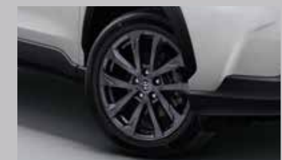
ล้ออัลลอยสีเทา ขนาด 18 นิ้ว สไตล์พรีเมียม