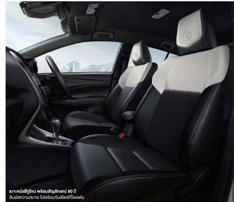
เบาะหนังสีทูโทน พร้อมสัญลักษณ์ 60 ปี สัมผัสความสบาย ไปพร้อมกับสไตล์ที่โดดเด่น