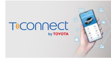
แอปพลิเคชัน T-Connect* สะดวกสบายยิ่งขึ้นด้วยบริการใหม่ เชื่อมการจับเคลื่อนที่แห่งอนาคต