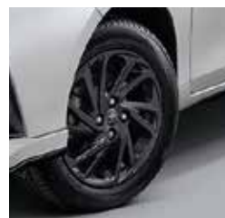
ล้ออัลลอยสีเทา ขนาด 15 นิ้ว สไตล์พรีเมียม