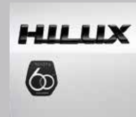
สัญลักษณ์ 60 ปี บริเวณด้านข้างซ้าย-ขวา

หมายเหตุ : โฉนด 513 สปรนท พื้นพรีมเมอร์ / 4x4 รุ่นพิเศษ 60 ปี เป็นรุ่นสปรนท พื้นทึบ 4 ล้อ 2.4 MID, รุ่นสปรนท พื้นทึบ 4 ล้อ 2.8 HIGH, รุ่นสปรนท พื้นพรีมเมอร์ พื้นทึบ 2 ล้อ 2.4 MID (MT/AT)